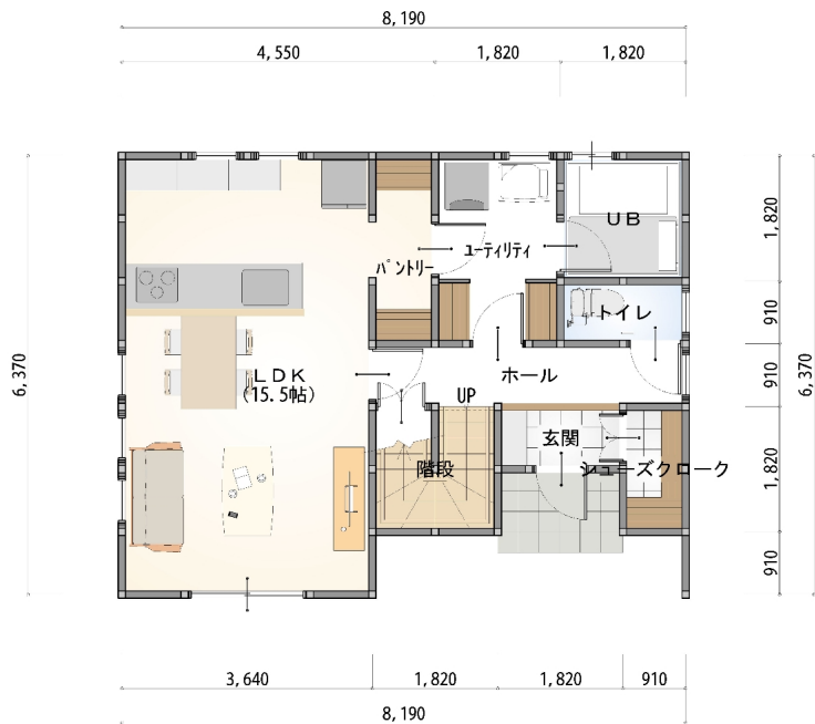
1階 平面図 S:1/80