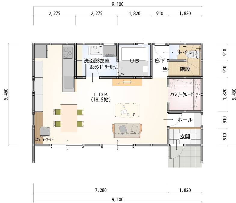
1階 平面図 S:1/80